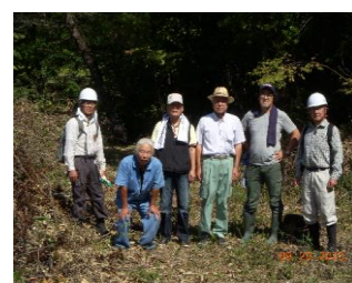
9/20 右近の森案内 千提寺自治会役員