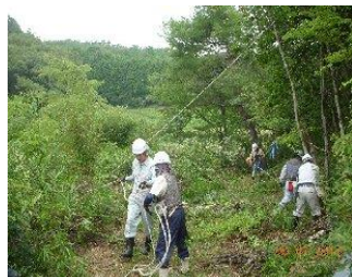
9/7 狭い場所では安全第一