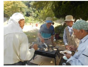
飲んべえーチーム談笑中