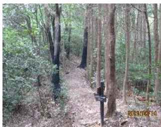
9/14 被害のコナラに黒布 効果は？