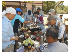
焼けてるよ！どんどん食べて！