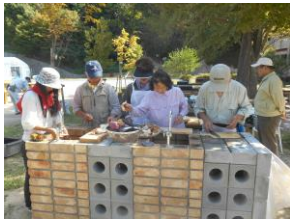
調理も手際よくやってまーす

秋晴れの下、今年は、30名が4テーブルに分かれてコンロを囲み、お肉や野菜をお腹いっぱい食べてサマータイム定例活動を締めくくった。