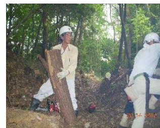
9/14 里道を塞ぐ倒木を処理