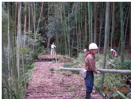
10/18 九分通り仕上がる