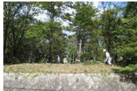
10/12 入り口付近スッキリ