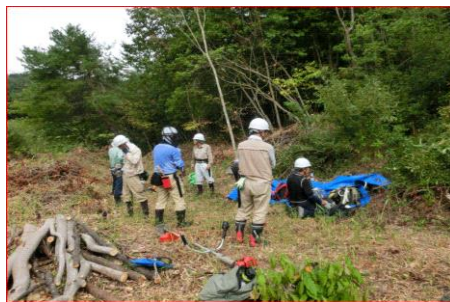
10/5 広くなった屋敷跡