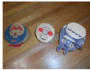
カスタネット(木の殿堂)