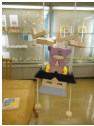
東栗倉おもちゃ村にて

手作りおもちゃと自然散策で大いに楽しんだ。大型バスに25名とゆったり楽ちん。手作りおもちゃがいっぱい展示。アイデアと精巧なつくり感動。自然林や植物園では、フィトンチッドいっぱいの森林浴を満喫。お弁当も美味しかった。夜な夜な、まじめ論議も？伯仲。