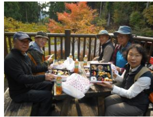
おかずいっぱい美味しそー！