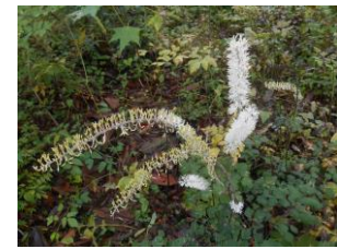
サラシナショウマ(植物園)