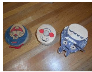
カスタネット (木の殿堂)