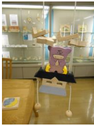
東栗倉おもちゃ村にて

手作りおもちゃと自然散策で大いに楽しんだ。大型バスに25名とゆったり楽ちん。手作りおもちゃがいっぱい展示。アイデアと精巧なつくり感動。自然林や植物園では、フィトンチッドいっぱいの森林浴を満喫。お弁当も美味しかった。夜な夜な、まじめ論議も？伯仲。