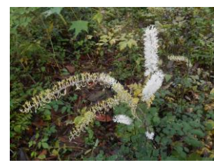
サラシナショウマ (植物園)