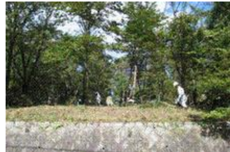
10/12 入り口付近スッキリ