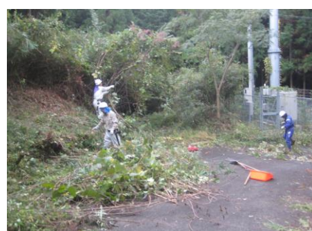
10/26 給水塔下部の下草刈り