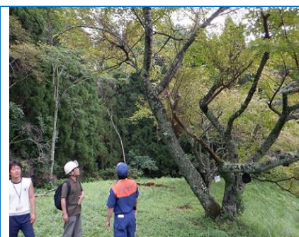
11日 消防署研修地（青少年センター）見学