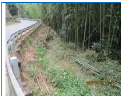
2日 まだま村の道路脇は見通しが良くなった