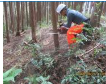
23日 オビロヒノキ林でのヒノキ間伐活動