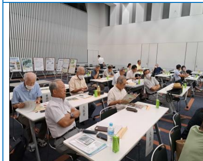
13日 林業コンクール会場の守る会座席