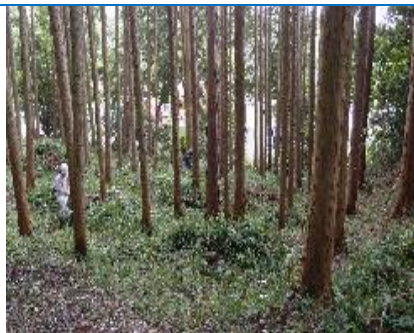
15日 菱ヶ谷北のEエリアは草刈り完了