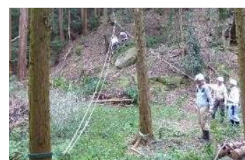
10日 伐木準備のロープ掛け