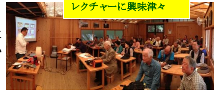
レクチャーに興味津々