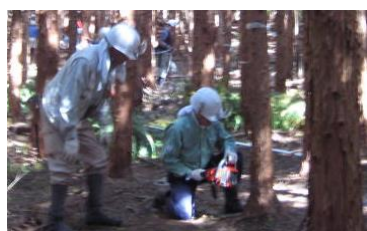
16日 チェンソー伐木指導中