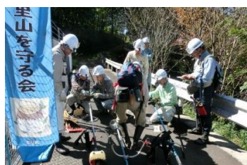
3日 作業機材の準備