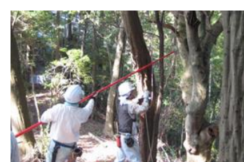
24日 安全作業を徹底