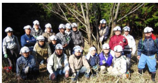
(13日)昼食休憩時に集合