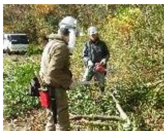
(6日)森の南面道路際整備