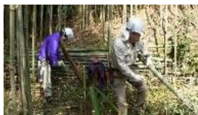
(14日)支柱用竹の伐採