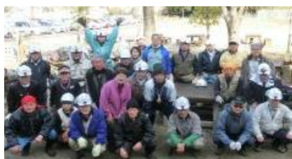
(7日)朝礼時全員集合