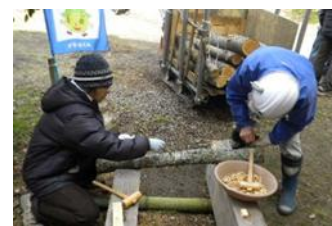
(28日)なめこの植菌初体験