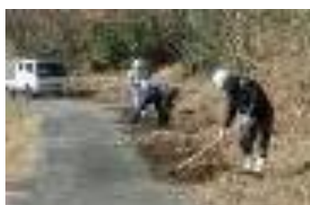
(7日)道路・側溝の土撤去