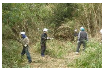
(20日)2本の太い篠竹を処理