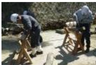
(28日)ホダ木にシイタケ植菌中