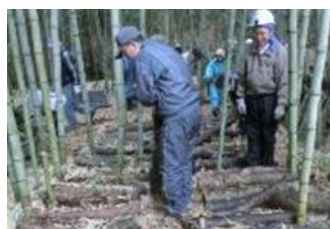
(7日)センターできのご圃場整備