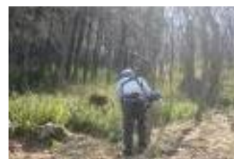
(28日)刈払機での笹刈り作業