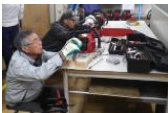
(14日)チェーンソー目立て中