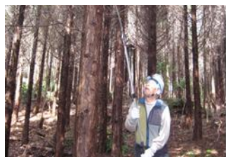
(20日)ヒノキ林で間伐と枝打ち