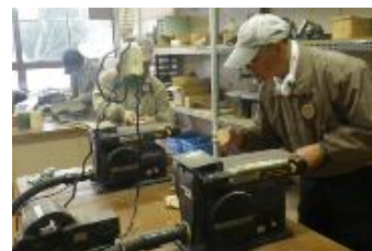
(14日)ペンダント台と竹笛材加工