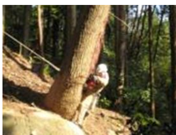
11日 直径60センチ樹齢75年を伐木