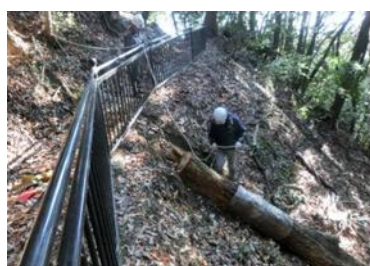
21日 ナラ枯れ危険木撤去