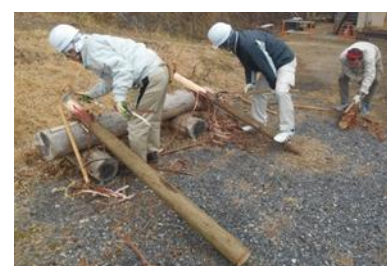
23日 ヒノキの皮むき