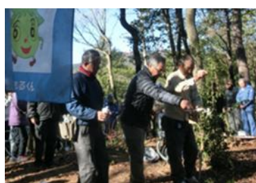
9日 今年も安全で楽しく