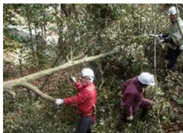
23日 展望台付近整備