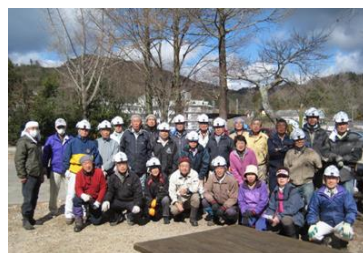
12日 安全で楽しくね