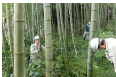
5日 初入山で竹の間伐作業