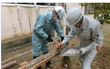
18日 シイタケ植菌作業