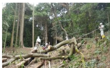
18日 放置伐採木の処理