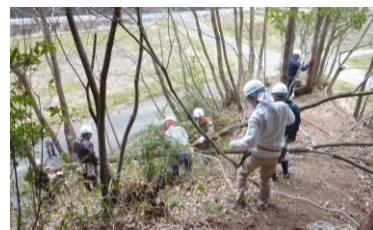
26日 ホダ木等の伐木