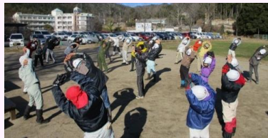
今年最初のストレッチ