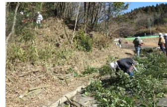
28日 伐木後の玉伐りと枝払い