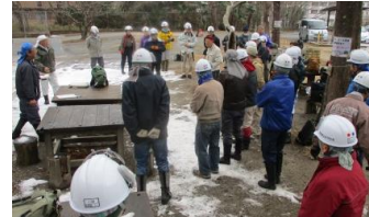
20日 雪の残る朝、本日作業説明