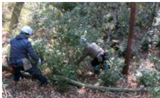
7日 初仕事にも力が入る