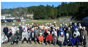
7日 今年も安全に楽しくやるぞ!