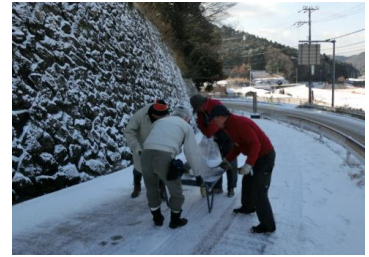
除雪と融雪剤の散布

当初、右近の森付近で間伐や除草作業などを行う予定でしたが、炭焼き用の上げ木の寸法切り等に変更し、活動しました。