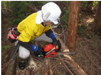
19日 チェーンソー伐木実習