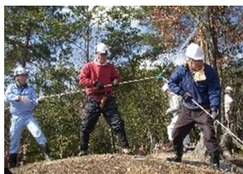
4日 コナラ伐木ロープワーク