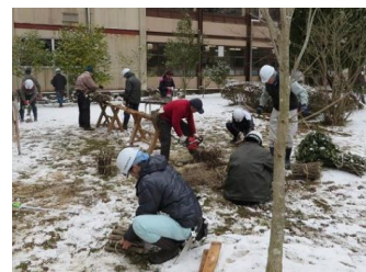
11日 炭焼きの上げ木の加工