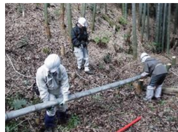
25日 コダン坂竹林整備