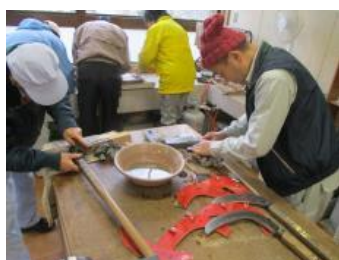
17日 刃砥ぎのお手本