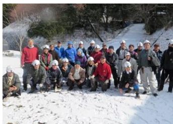
11日 大寒波にも負けない