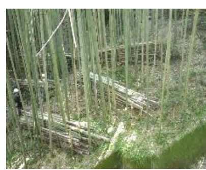
13日 中ん谷の竹林が綺麗