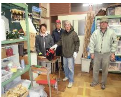
11日 機械の整備 感謝・感謝