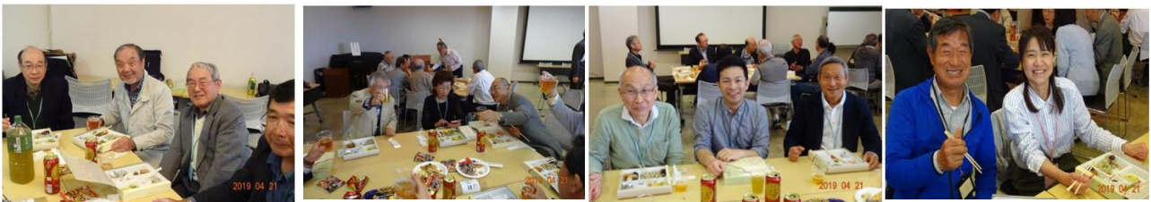
50人の参加で、14期の方も楽しく歓談されていました。