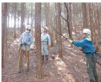
6日 見立ヒノキ林の整備