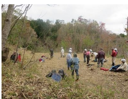
19日 右近の森 草刈り作業