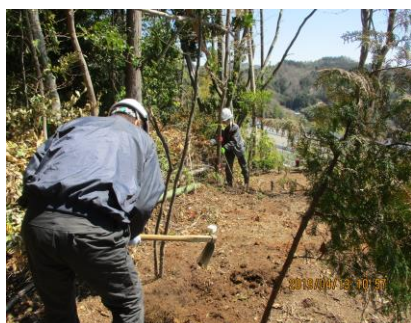
13日 前の山にさるなし植樹