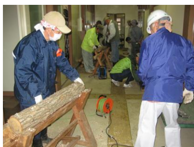
コナラのホダ木に、シイタケ菌を植菌