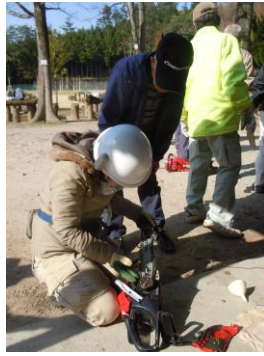
道具は大切に！チェーンソーの掃除