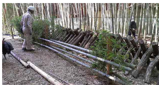
仮伏せにマムシが巣くっていると脅かされながら、恐る恐るホダ木を移動