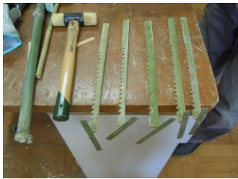
よく回転するよ ガリガリプロペラ製作中