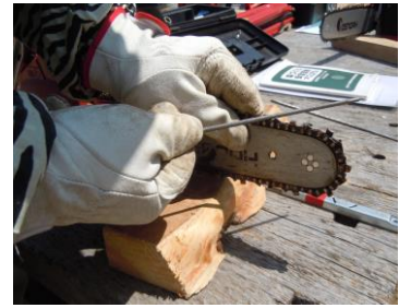
正しい目立ては安全面でも大切