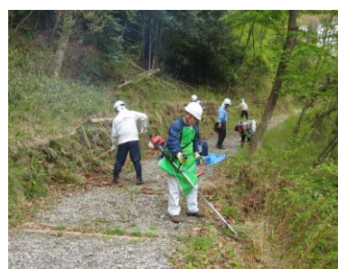
道路奥の整備風景